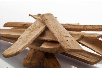
Aubier de tilleul

Le printemps est une période idéale pour les cures détoxifiantes. Pour cela, rien de tel qu'une tisane d'aubier de tilleul pour nettoyer reins et vessie ainsi que pour drainer les acides accumulés durant l'hiver et dus à une nourriture plus riche.