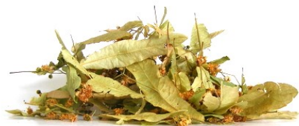
Flours de tilleul avec bractée

La fleur de tilleul est également utilisée pour ses propriétés sédatives légères chez l'adulte et l'enfant en favorisant le sommeil (huile essentielle), pour ses vertus émollientes (mucilages) en bain lors d'affections cutanées tel que gerçures, écorchures, crevasses et également dans le traitement des piqûres d'insecte (topique).