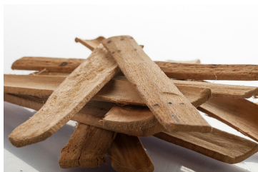
Aubier de tilleul du Roussillon

En effet, l'influence de l'aubier de tilleul sur le foie en même temps que sur les reins lui confère des propriétés très intéressantes au printemps : celles de drainer les toxines accumulées. Propriétés également intéressantes dans le traitement des rhumatismes et de la goutte ainsi que pour prévenir la formation de calculs urinaires. L'aubier fournit des minéraux et oligo-éléments précieux lors de changement de rythme saisonnier (cure de printemps).